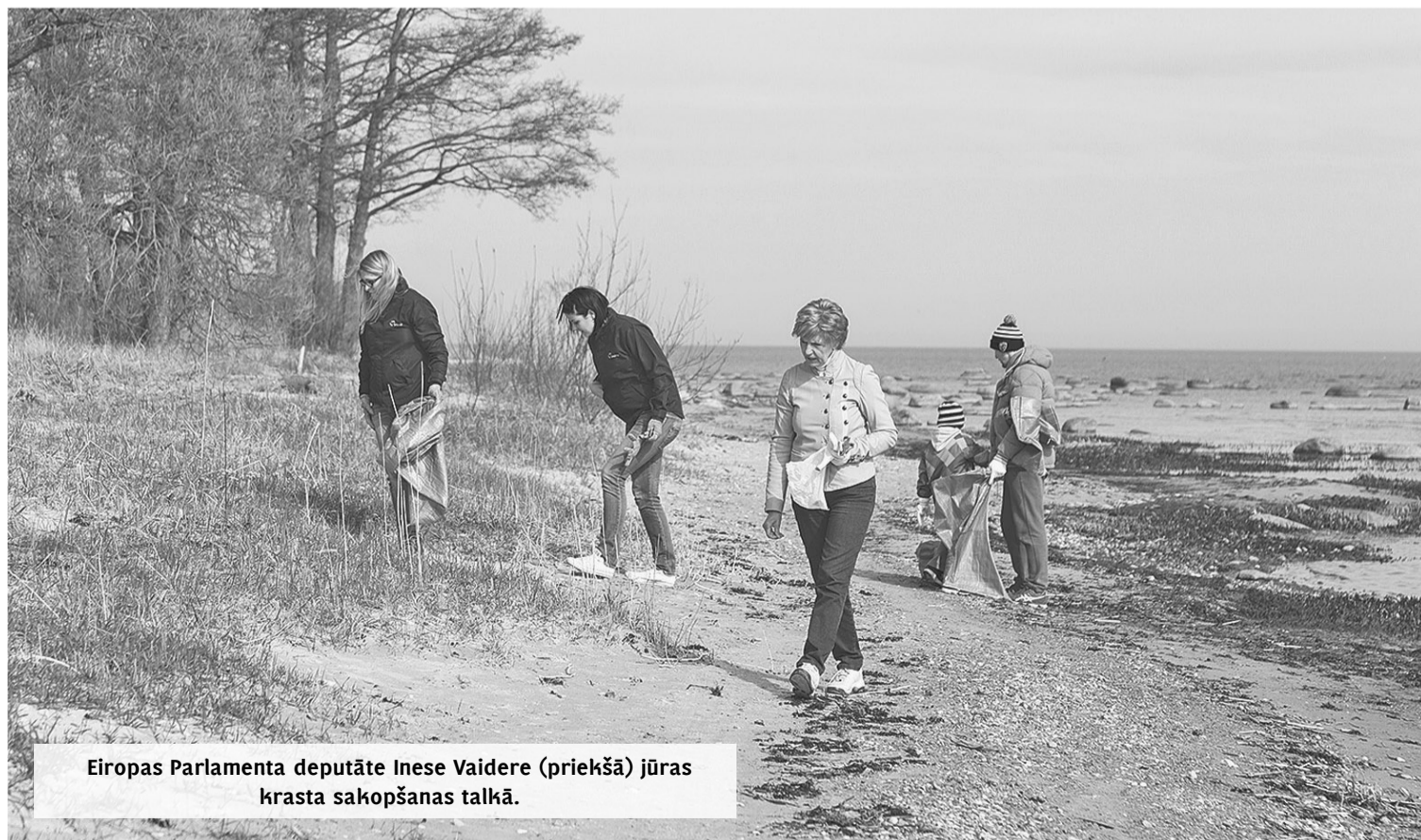
Eiropas Parlamenta deputāte Inese Vaidere (priekšā) jūras krasta sakopšanas talkā.

Drāniņu lietošana ir pavisam vienkārša. To var izmantot veselu gadu, ja pareizi kopj – mazgā tekošā ūdenī, izžāvē. Nedrīkst turēt karstā saulē, kā arī iepakot siltu ēdienu. Sveigas zivis un gaļu arī nebūtu vēlams tīt šajā drāniņā."