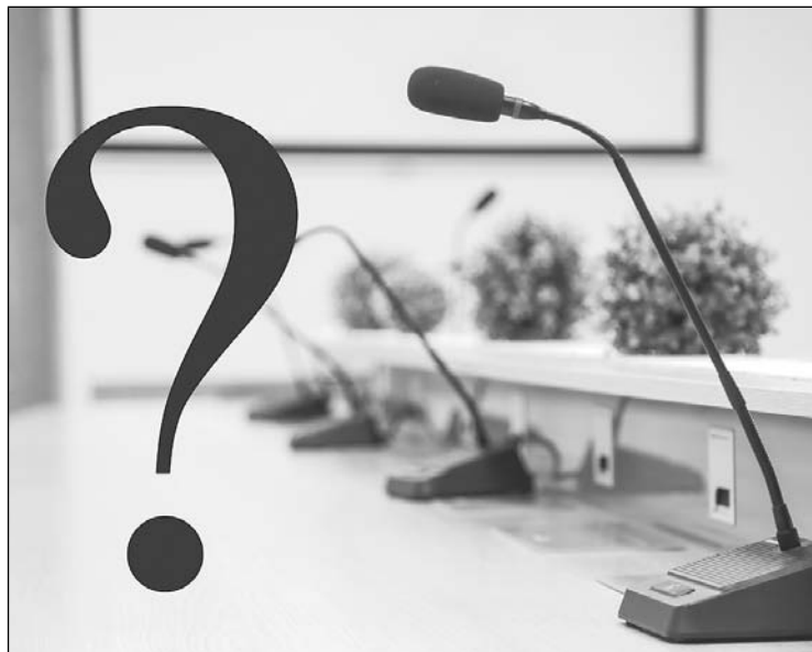
Pirms diskusijas nekad nevar zināt, cik asā formā tā izvēršies...

“Labas diskusijas rezultāts ir kvalitatīvs lēmums, kura pieņemšanas procesā tiek vērtēti visdažādākie viedokļi neatkarīgi no tā, kurš lēmumprojekta apspriešanā iesaistītais ir paudis priekšlikumus vai kritiku. Agrāk, vadot pašvaldību, vienmēr centos to ievērot, neuzturēt pozīcijas un opozīcijas attiecību formātu domes darbā. Visiem domē ievēlētajiem deputātiem gan lēmumprojekta apspriešanas, gan balsošanas procesā jādarbojas atbilstoši savam problēmas risi-