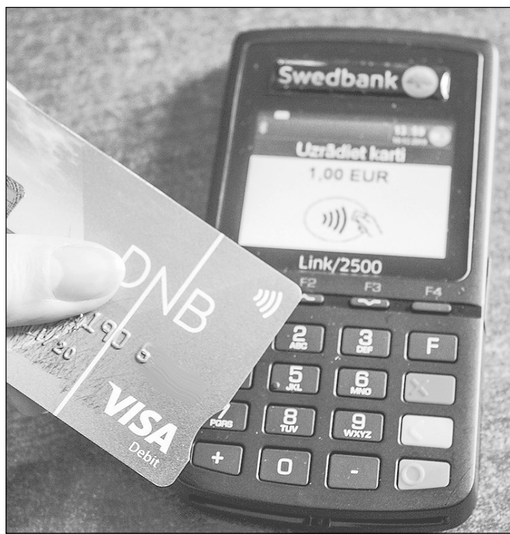
Latvijas iedzīvotāju norēķinu paradumu pētījums apliecina, ka bezkontakta maksāšanas iespēja kļūst arvien populārāka.

Šoruden uzņēmums "Mastercard" un Finanšu nozares asociācija informatīvajā kampaņā "Piik, un gatavs!" pētīja Latvijas iedzīvotāju norēķinu paradumus. Aptaujā noskaidrots, ka teju 75% iedzīvotāju ir maksājumu kartes ar bezkontakta norēķinu iespēju, bet 23% šāda maksāšanas iespēja pieslēgta arī mobilajā telefonā, viedaprocē vai viedpulkstenī. Asociācijas informācija liecina, ka līdz šā gada vidum Latvijā aktīvas bija 2 161 824 maksājumu kartes, no tām vairāk nekā puse bija aprīkotas ar bezkontakta tehnoloģiju. Karšu norēķini pieejami jau vismaz 30 tūkstošos tirdzniecības vietu valstī, un no