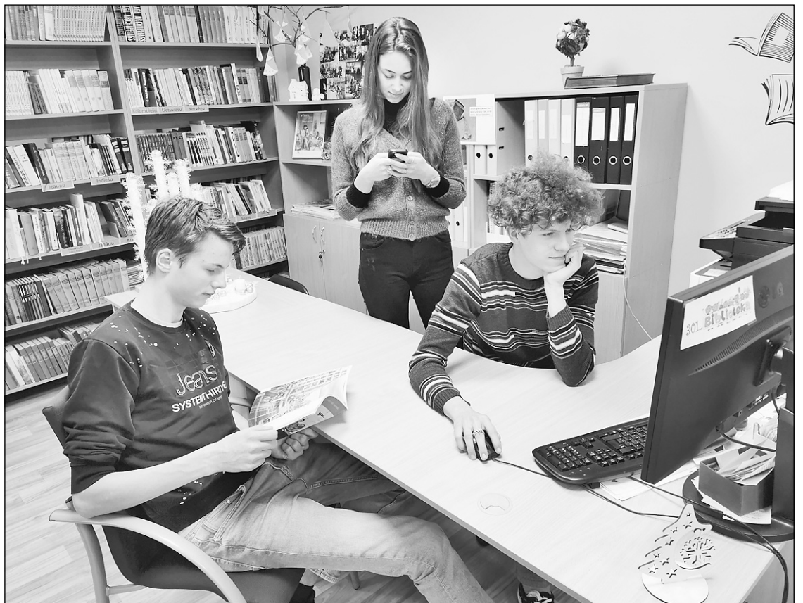
Jaunieši uzskata, ka nākotnē avīzes, iespējams, neeksistēs, jo paaudze, kurai avīzes ir svarīgas, palēnam iet mazumā. "Tie, kuri vēlēties lasīt avīzes, pielāgosies - visu var atrast internetā," viņi saka.