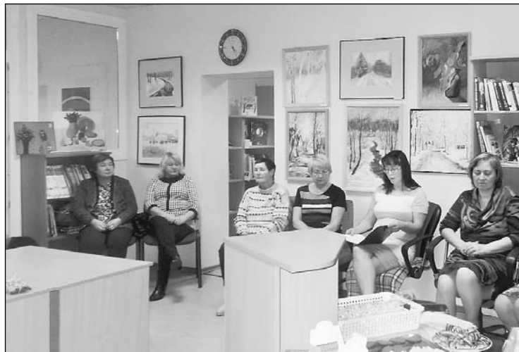
Bērsaunes pagasta mākslas studijas gleznu izstādes bieži ir apskatāmas bibliotēkā.