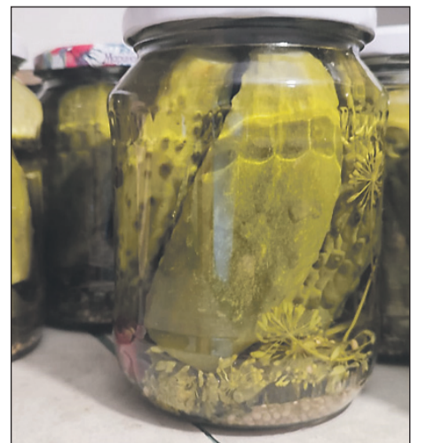
Skaistumam, veselībai un garšas kārpīnām.