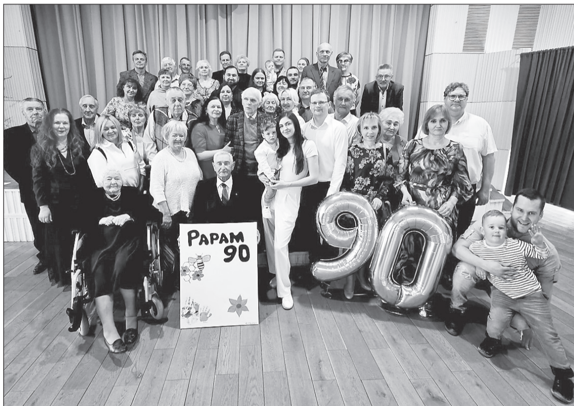
Daudzie vēlējumi jubilejā dod stimulu ikdienai.

Pēc profesijas esmu elektroenerģētiķis. Par elektriķi un “Latvenergo” Madonas elektrisko tīklu rajona priekšnieku nostrādāju 42 gadus. Ar biškopību