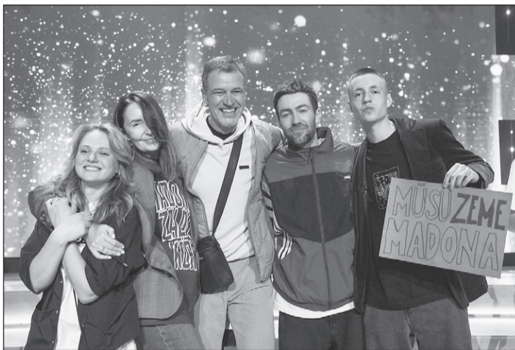
Kopā ar ģimeni "Koru karos".

Fiziskās formas uzlabošana trenera vadībā sporta klubā „NeoGym” Madonā, Saules ielā 10. Aivis — t. 29113146.