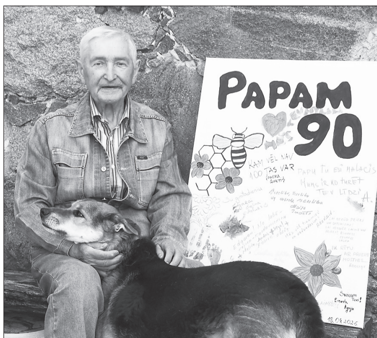
“Papu, tu esi malacis, mums ir, ko turēt tev līdzī”, — veltījumā jubilejā savam vectēvam rakstīja ģimene.