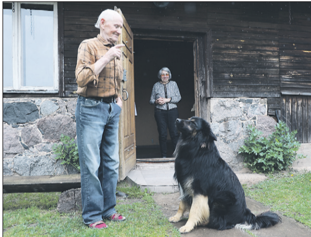
Ciemiņiem jāparāda viss, ko māk — Rembo labprāt demonstrē paklausību, izpildot saimnieka komandas.