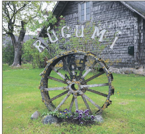
„Rūgumi” ir ista miera osta.