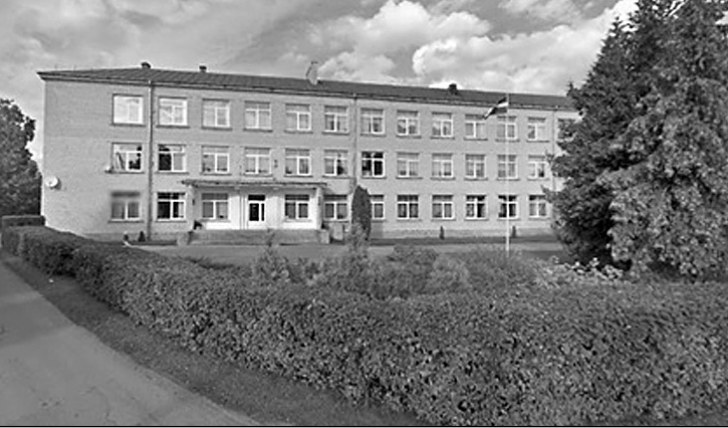
26. kājnieku bataljons, kas izvietots Gulbenē, tiks pārcelts uz Cesvaini, bijušo internātpamatskolas ēku.

Pamazām arī pašvaldības nostiprinās apzina, ka civilās aizsardzība sistēma ir visaptverošs valsts aizsardzības koncepcijas sastāvdaļa. Lai to sekmīgi ieviestu, ir nepieciešama valsts pārvaldes iestāžu, pašvaldību un NBS sadarbība vienotās izpratnes veidošanai. Katras kopīgas mācības ir solis pretim šim mērķim.