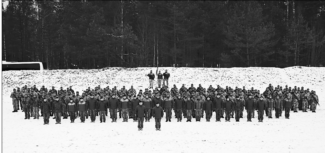
Pamatapmācība ir pirmais lielais solis zemessarga dienestā.

No 27. līdz 29. janvārim norisinājās pamatapmācības pēdējais bloks, kurā tika pārbaudītas zināšanas, ko jaunie zemessargi ir apguvuši visas pamatapmācības laikā.