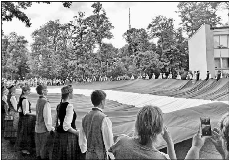
Episkā izmēra Latvijas karogs darināts par godu valsts simtgadei un 18. novembrī tiks pacelts starp Zaķusalas TV torņa balstiem.