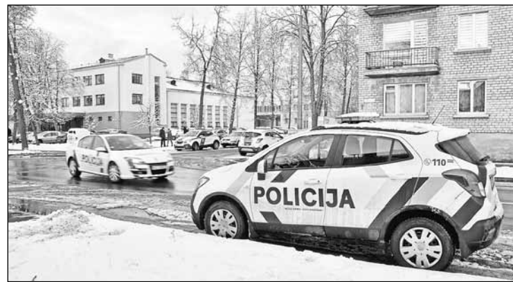
Tūlītēja apdraudējuma gadījumā ikvienu personu — gan vardarbībā cietušās personas, gan viņu tuvinieki vai kaimiņi — aicināti zvanīt pa tālruni 110, lai tiktu novērstas vardarbības.

Valsts policija ir tas dienests, kas uz vardarbības gadījumiem ģimenē dodas situācijās, kad nepieciešama tūlītēja palīdzība. Attiecīgi ikvienu personu tūlītēja apdraudējuma gadījumā tiek aicināta zvanīt pa tālruni 110.