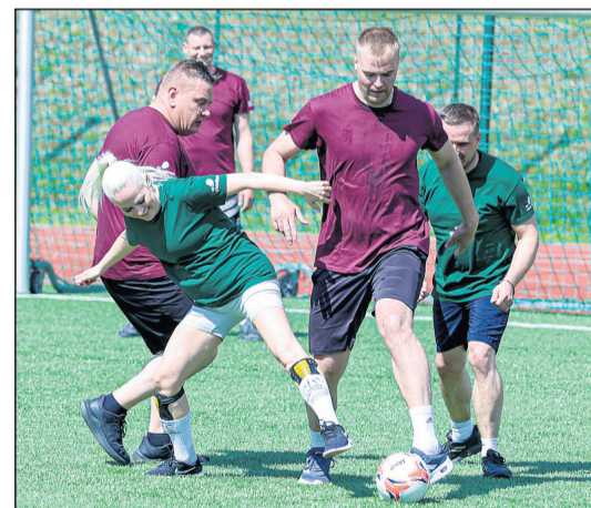
Futbolu spēlē arī dāmas.

Šajā spēlē pirmo reizi novada vēsturē tīkās Madonas novada domes deputātu un Centrālās administrācijas komanda ar Madonas novada apvienību un pārvalžu vadītāju komandu, kurai pievienojās arī īpašumu uzturēšanas nodaļu darbinieki. Azartiskā, bet draudzīgi gaisotnē abas komandas aizvadīja divus divdesmit minūšu spāliņus, demonstrējot gan sportisku cīņassparu, gan saliedētību.