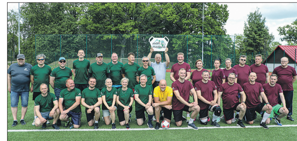
Draudzība vienmēr uzvar — arī šajās sacensībās.