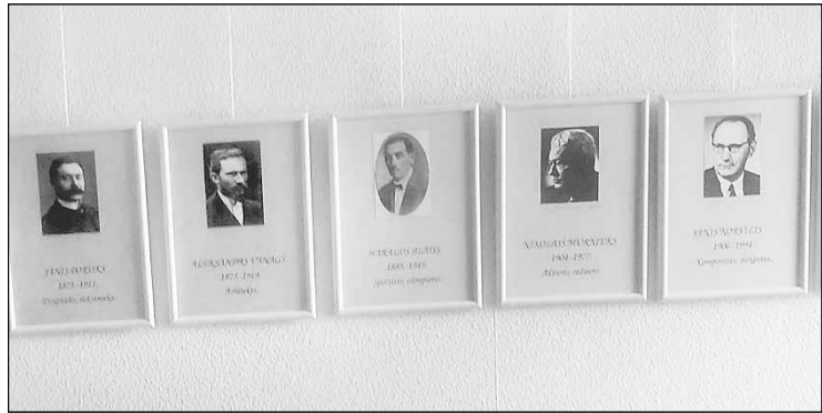
Daļa fotogrāfiju no Liezēres pagasta bibliotēkā atklātās Novadnieku galerijas.