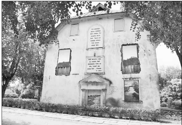
Apgleznojot vēsturiskās skolas ēkas logus, izmantoti gan dabas motīvi, gan Andreja Eglīša dzejas vārsmas.