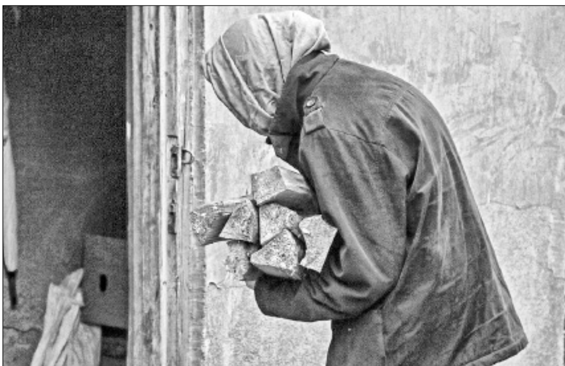
Trūcīgas un maznodrošinātas personas (ģimenes) var saņemt mājokļa (dzīvokļa) pabalstu, tai skaitā kurināmā iegādē.

Jāpiebilst, ka vairākas no minētajām pašvaldībām ir arī pabalsti, kas tiek piešķirti, neizmērtējot iedzīvotāju ienākumu līmeni, bet gan ņemot vērā piederību kādai mērķa grupai,