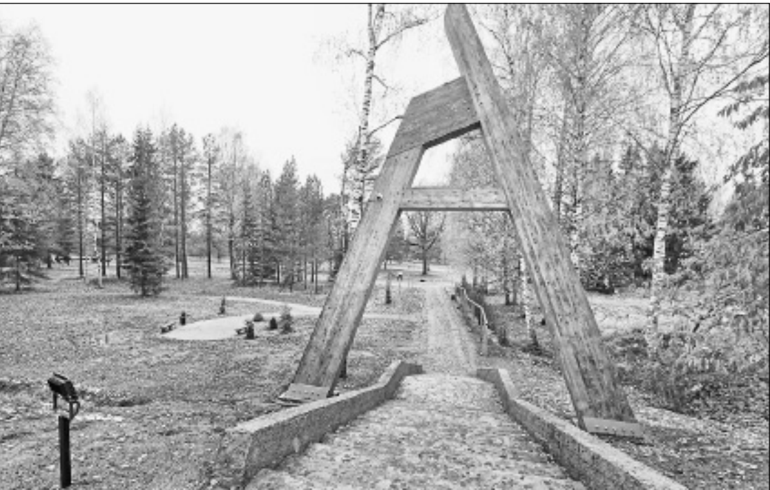
Šajās dienās tiek pabeigta projekta īstenošana par J. Alunāna parka atjaunošanu Kalsnavas pagastā.