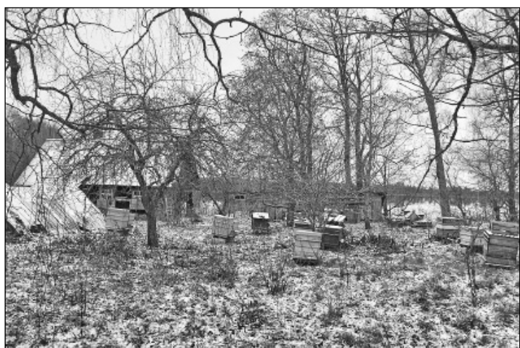
Sīksalā viena no retajām mājām, kura liecina, ka te vēl cilvēki uzturas, saimnieko, ka sala nav pamesta.

Tagad, iebraukusi Sīksalā, redzam vairi tikai dažas mājvietas, arī sagruvušas mājas, vien divās vēl pastāvīgi dzīvo. Vairāk atbraucēju interentu, arī tūristu, tostarp ārzemnieku, tie iegriežas vasarā, kad daba šeit ir skaista, un veldzi sniedz