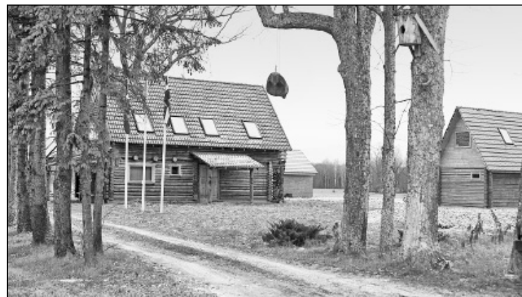
Biedrības "Murmastiene" ekonomijā "Trizelnieku Ignatiņi" ir piemērs, kā izmantot saules un vēja enerģiju.

Pašiem kluba aktīvistiem jau aizmirsies, ka iepriekš tie, kur uzbūvēts mednieku namiņš, Trizelnieku sādžā atradās tikai mājas vieta, vecs, aizaudzis dārzs, sakrituši koki. Koku aleja tie saglabāta, bet namiņš, lai arī uzcelts no jauna, ir dabai draudzīgs — koka gūļbūve, kas aprīkota ar saules kolektoriem, baterijām, vēja ģeneratoru un visām ēkstrām, par ko brīnās apmeklētāji. Mājā, kas atrodas dziļos laukos, ir ūdensvads, duša, pirmajā stāvā ir kamina istaba, tajā ir kļavas koka galdi un soli, koks — dabiskis, tikai noslīpēts. Otrajā stāvā nokļūstam pa lača pakāpieniem, kur ir iespēja dzīvot kādā no istabām, kas katra ir no sava koka un smaržo citādāk. Ozola, oša, egļu, priežu istabā ir šo koku mēbeles, ko darinājis vietējais meistars. Arī namiņš kalpo pārsvarā tikai biedrības biedriem, dabas draugiem, bet ne viesību pakal-