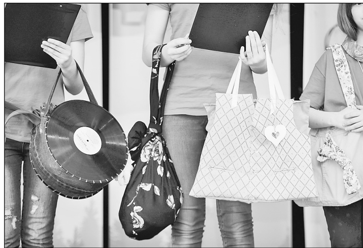
Tik oriģinālas un daudzveidīgas somas iespējams iegūt, izmantojot nevajadzīgas lietas un auduma atgriezumus. Šajā foto redzamas dažas no bērnu idejām, ar ko var aizstāt plastmasas iepakojuma maisus projekta „Es sāku ar sevi — tīrai Latvijai” ietvaros.

Viņa uzsver, ka ikviens Latvijai iedzīvotājiem jāiemana un arī uzņēmuma mērķis ir atbildīga atkritumu šķirošana un maksimāla resursu taupība. Iedzīvotāju izglītošanas nolūkos tiek organizētas dažādas informatīvās kampaņas par atkritumu šķirošanu, gan to, kā radīt pēc