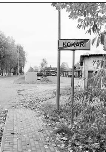
Pārsteidzoši labs tagad ir Kokaru ceļš jeb tā sauktās Latgales prospekti.

Projekta „Uzņēmējdarbības vides attīstībai nepieciešamās infrastruktūras uzlabošana Varakļānu novadā, Murmastienes pagastā” ietvaros tika pārbūvēti Murmastienes pagasta ceļu Karolīna—Inčārnieki un Tumaševa—Inčārnieki posmi, kopumā 2 km garumā. Projekta ko-