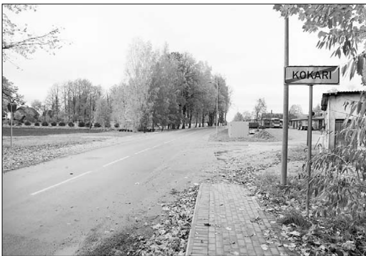
Pārsteidzoši labs tagad ir Kokaru ceļš jeb tā sauktās Latgales prospekti.

Uzņēmējdarbības infrastruktūras attīstībai Varakļānu pilsētā projekta ietvaros ir veikta Varakļānu pilsētas Miera, Ozolu, Fabrikas ielas un Dārzu, Pils, Jaunatnes ielas posmu pārbūve. Projekta kopējās izmaksas — 790 247,58 eiro, Eiropas Sa-