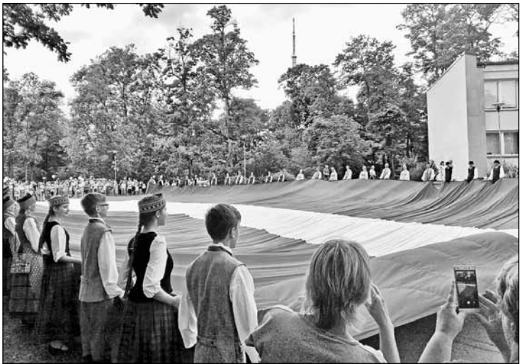
Episkā izmēra Latvijas karogs darināts par godu valsts simtgadei un 18. novembrī tiks pacelts starp Zaķusalas TV torņa balstiem.