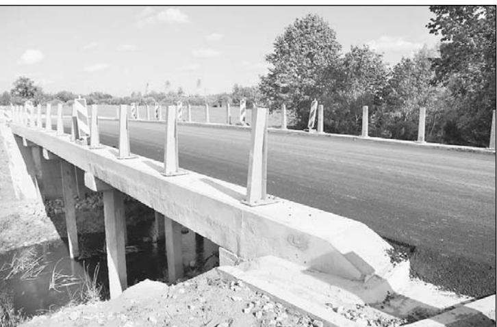
Projekta ietvaros tika sakārtoti grāvji un tilts pār Liedes upi Inčānu pagastā. Vēl ir atlikuši nelieli darbi, lai ceļa posms Jaunie kapi—Birznieki—Dambīši novembra beigās tiktu pabeigts.

Projektu īstenošanā iesaistās arī izglītības iestādes. Kopš šā gada februāra Lubānas novada pašvaldībā ir uzskāss Izglītības kvalitātes valsts dienesta īstenošanai Eiropas Sociālā fonda projekta „Atbalsts priekšlaičīgās mācību pārtraukšanas samazināšanai” realizāciju Lubānas vidusskolā 5.—12. klašu izglītojamajiem, lai mazinātu to bērnu un jauniešu skaitu, kas pārtrauc mācības un nepabeidz skolu. Gan Lubānas